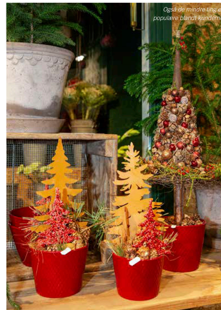
Også de mindre ting er populære blandt kunderne